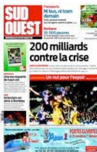
Sud Ouest (tabloïd depuis mars 2002)