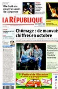
Rép. du Centre (tabloïd depuis janvier 2003)