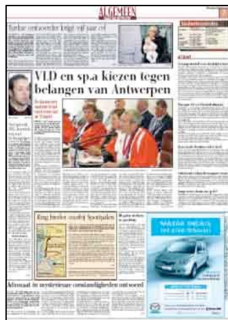
Catégorie 1 Format identique