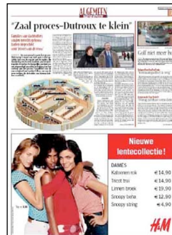
Catégorie 2 Format proportionnel