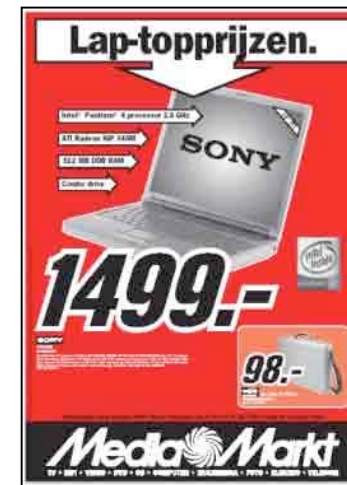
Catégorie 3 Format pleine page