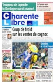
Charente Libre (tabloïd depuis mars 2000)

35 réductions de format en PQR et en PQD depuis 2000 : 85% des quotidiens régionaux et départementaux proposent aujourd'hui un format réduit.